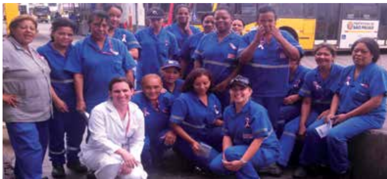
Unidade A.E. Carvalho