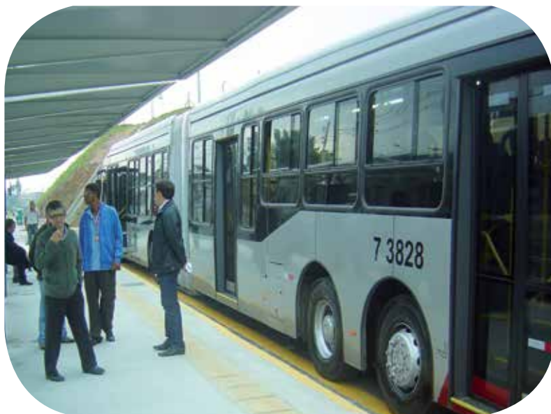
Obra finalizada no Morro do Índio trouxe melhorias

Os usuários das linhas de ônibus que chegam e saem do Morro do Índio, na Zona Sul de São Paulo, contam agora com uma nova área de transferência de passageiros. Localizado na Estrada M'Boi Mirim, na altura do nº 5.711, o terminal vem trazendo benefícios que a população da região reconhece: mais conforto, segurança e comodidade.