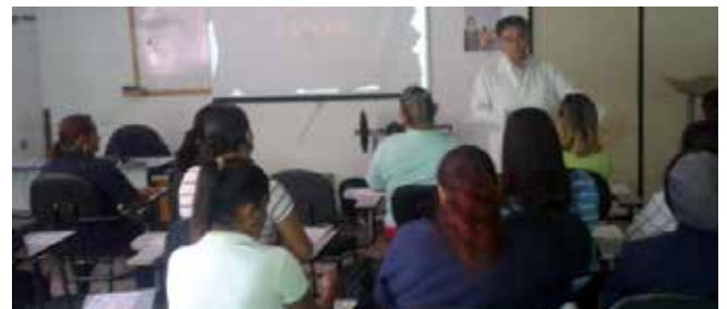
Unidade M'Boi Mirim