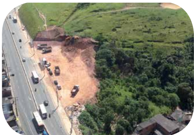
Morro do Índio (à esq.) antes e (à dir.) durante a construção